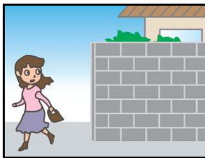
危ない場所から離れて！