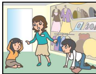
お店では、あわてず係員の指示に従って！